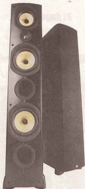
PSB Image Kraft og