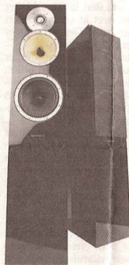
Bowers & Wilkins CM7 Gammel klassiker i